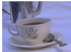
Compañerismo regular es la clave exitosa para la transición de prisioneros

En los EE.UU. la población carcelaria ha aumentado en los últimos años. De acuerdo con el sitio web del Departamento de Justicia de los EE.UU. hubo 2,229,116 reclusos en cárceles y prisiones de los EE.UU. el 30 de junio del 2007, lo que refleja un aumento de 1.8% respecto al 2006. Esto se debe al incremento medio de 2.6% durante 2000-2006. Los registros del FBI indican que las agencias policiales informaron una disminución de 1.4% en crímenes violentos y una disminución de 2.1% en los delitos contra la propiedad en el 2007, en comparación con el 2006. Esto demuestra que los recientes cambios en la legislación sobre delitos han sido eficaces para conseguir a los delincuentes de las calles y ponerlos tras las rejas. Lamentablemente, las estadísticas también muestran que aproximadamente dos tercios de los liberados de cárceles y prisiones vuelven a ofender las leyes a los tres años de su liberación. Normalmente, los internos regresan a sus comunidades sin dinero y sin un