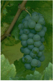
Sembrando semillas de esperanza: Creciendo juntos compartiendo el amor de Dios

Se arraiga en la creencia de que la respuesta al problema de la delincuencia en nuestros vecindarios y en nuestro país radica en el cambio de los corazones y las mentes de los delincuentes al ofrecerles el amor de Dios. Seeds of Hope se inició con un grupo de voluntarios del Ministerio de la Biblia de Gideon ofreciendo testimonios a los reclusos en la prisión del condado de Finney en el 2003. Muchos reclusos respondieron al Evangelio y pidieron Biblias y materiales de estudio. Desde entonces, muchos otros individuos que son miembros de diversas iglesias de la zona se han unido en esta misión para ofrecer apoyo comunitario de fe a los presos. Seeds of Hope fue creada en septiembre del 2007, para llenar la necesidad de un ministerio de presencia a tiempo completo en la cárcel. Desde entonces, hemos ampliado nuestro ministerio para servir a los ex reclusos y sus familias después de su liberación. Esperamos continuar creciendo en la profundidad y la amplitud de las actividades y servicios ofrecidos. Las posibilidades futuras de transición incluyen la prestación de empleo y de vivienda para los presos. Buscamos la participación de miembros de todos los segmentos de nuestra comunidad en este esfuerzo, incluyendo a los ex presos y sus familias.